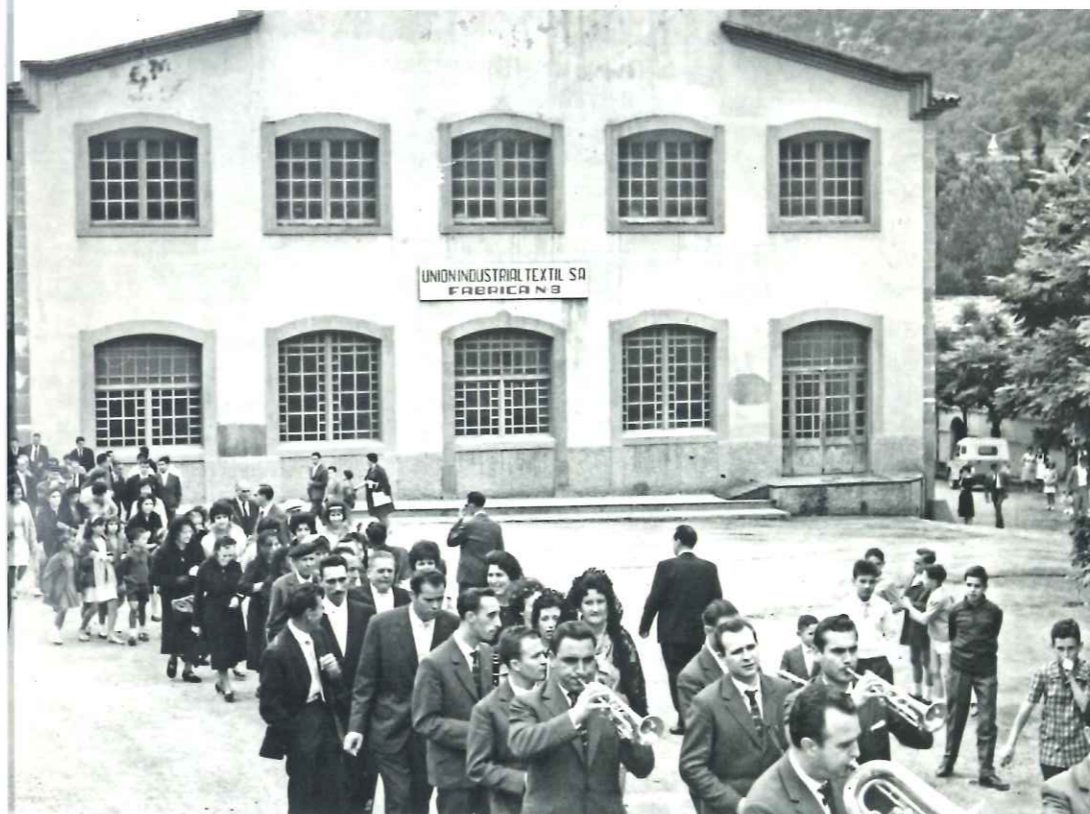
→ Seguici de la festa de l'Homenatge a la Vellesa, als anys cinquanta, al seu pas per davant de la fàbrica, a la plaça de la colònia.