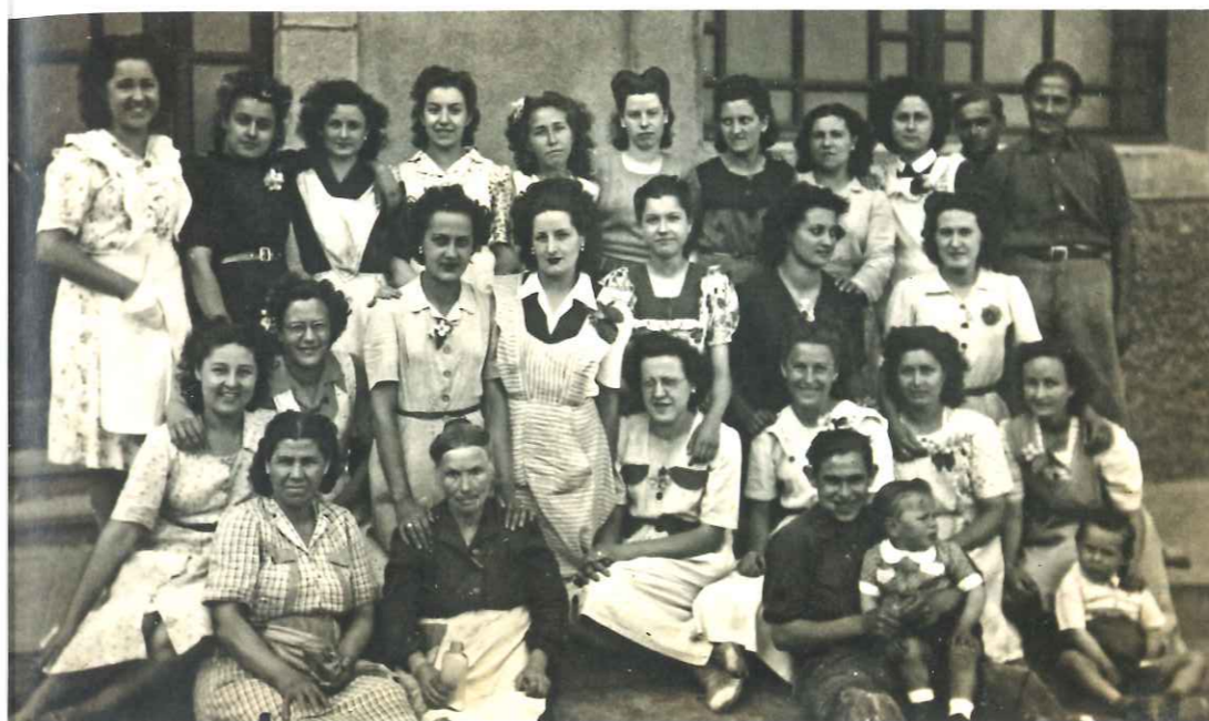
→ Grup de treballadores davant la fàbrica als anys cinquanta. La mà d'obra femenina significava un estalvi per a l'empresari.