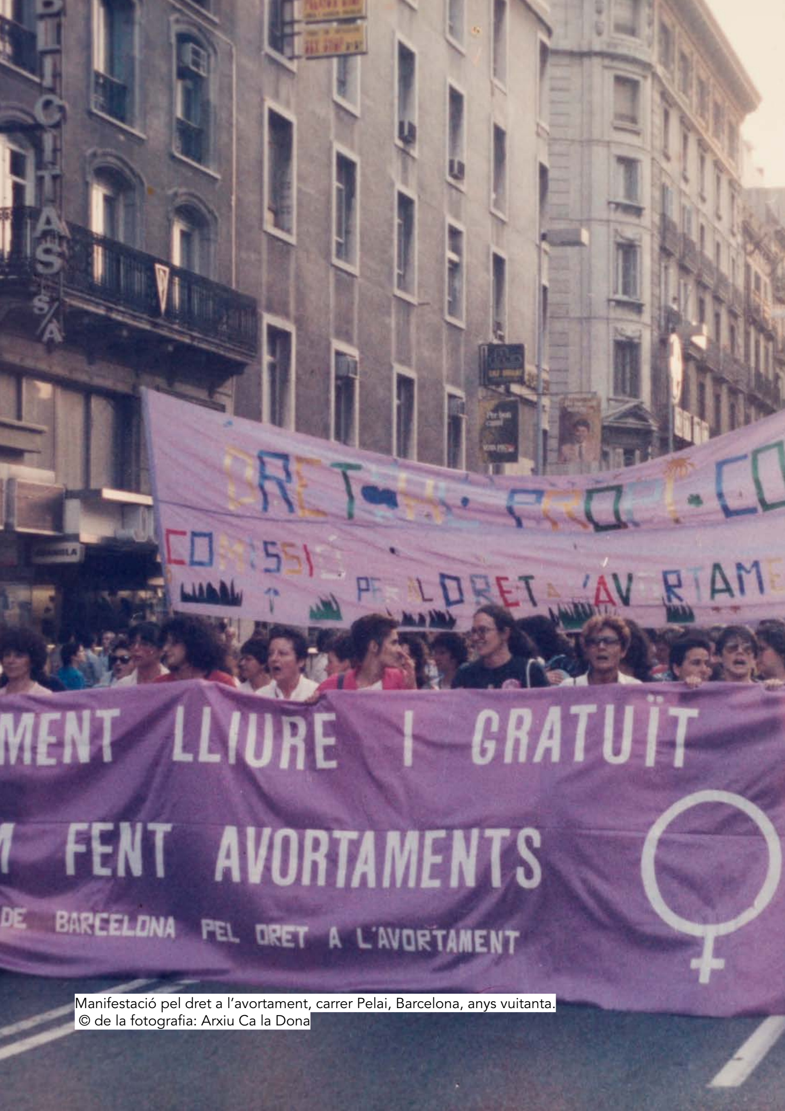
Manifestació pel dret a l'avortament, carrer Pelai, Barcelona, anys vuitanta.