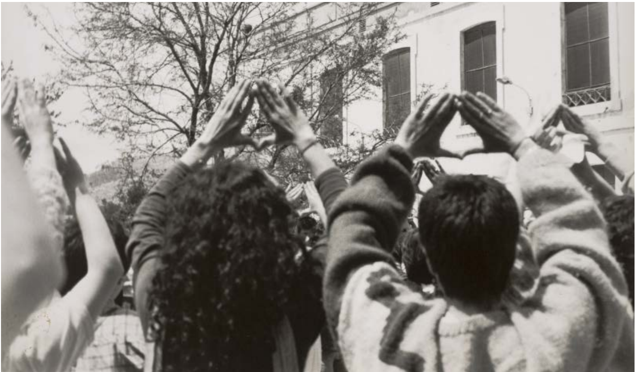
Acampada de Dones per la Pau a Tortosa, maig de 1985.

Precisament, les Jornades obriren el debat públic sobre la sexualitat i els drets reproductius com a punts bàsics de la cultura política democràtica. Defensant la llibertat sexual femenina, la planificació familiar, el dret als anticonceptius i a l'avortament identificaren en públic els drets de les dones en aquest terreny tabú. D'aquesta manera consolidaren un dels postulats bàsics del nou feminisme de convertir allò que és personal en política. A partir d'aquell moment, en un llenguatge polític, el moviment de dones va avançar en la definició dels drets reproductius com a inherents als drets ciutadans.