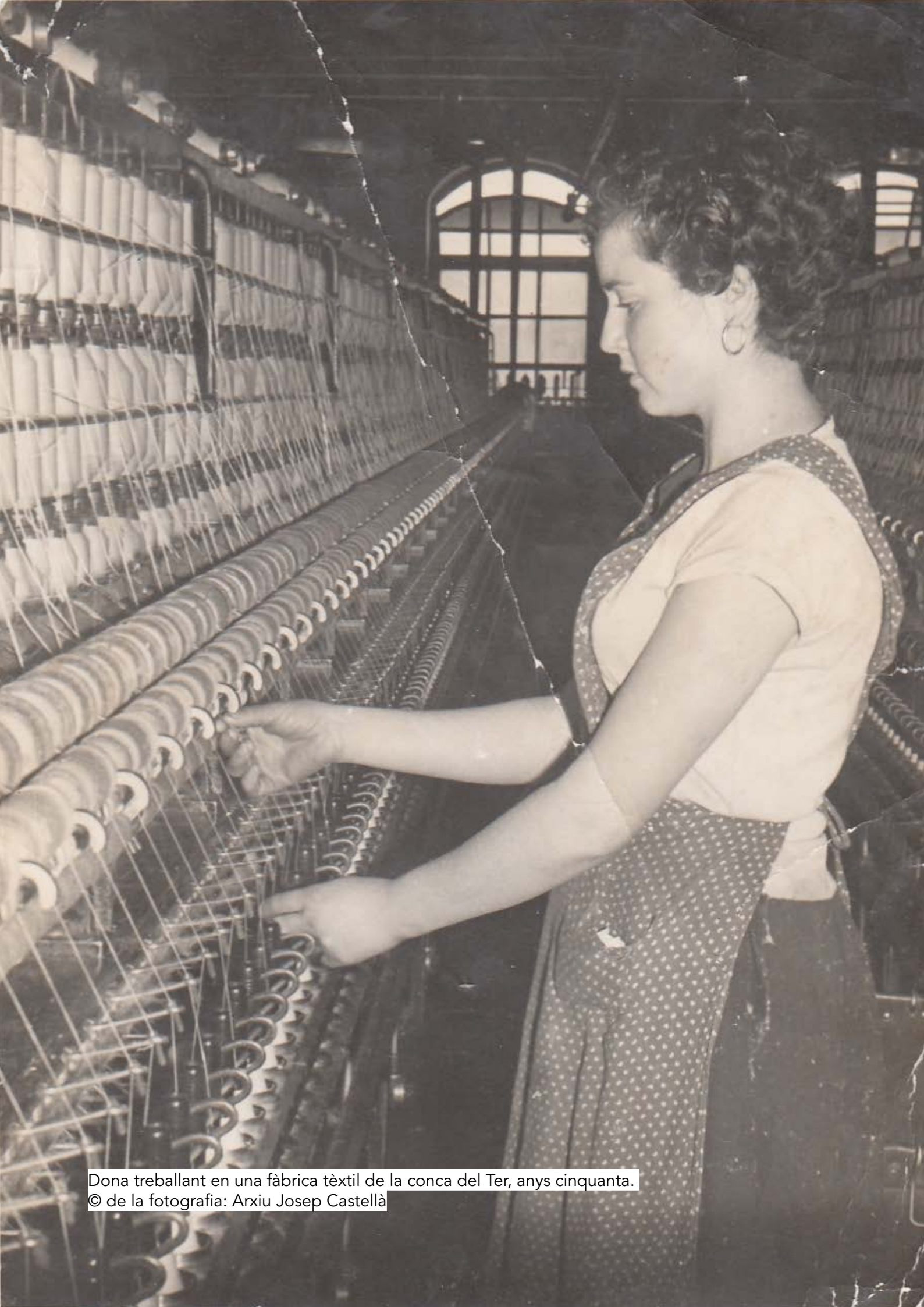
Dona treballant en una fàbrica tèxtil de la conca del Ter, anys cinquanta.