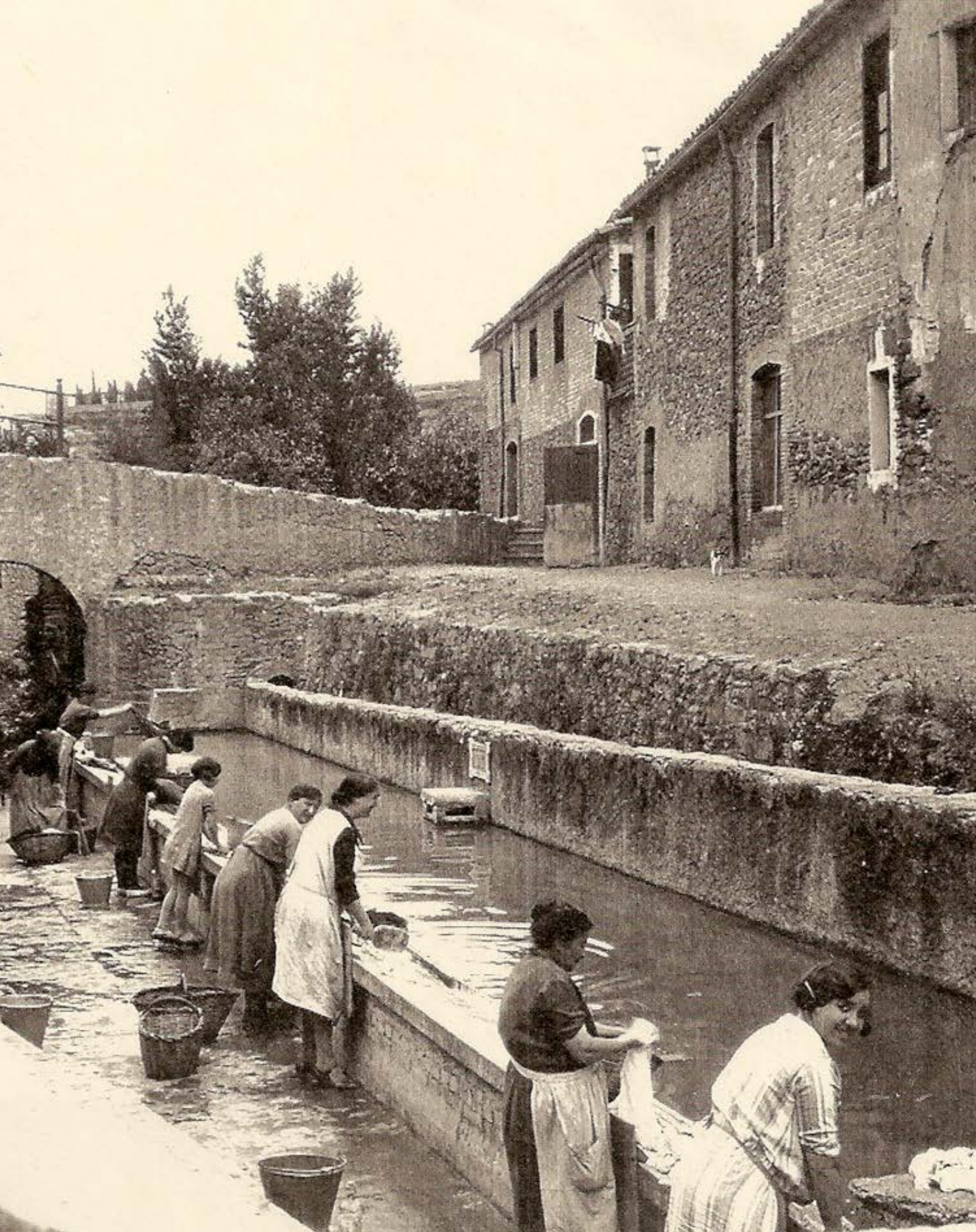
Algunes dones fent la bugada, cadascuna d'elles amb el cistell que utilitzaven per portar la roba, al safareig públic de les Tres Fonts, a Roda de Ter, anys vint.