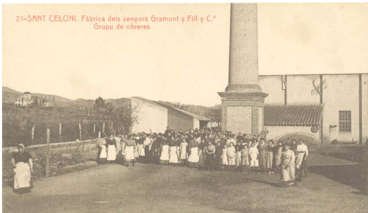
21-SANT CELONI. Fàbrica dels senyors Gramunt y Fill y C. a Grup de obreres

Com és prou conegut, l'activitat laboral de les dones i de la resta de treballadors a les colònies industrials també va ser una peça clau de la industrialització a Catalunya. Concebudes com a pobles privats, el paternalisme industrial va trobar en aquesta fórmula el mecanisme idoni per establir la pau social, el control ideològic i fixar la conducta moral dels treballadors i les treballadores.