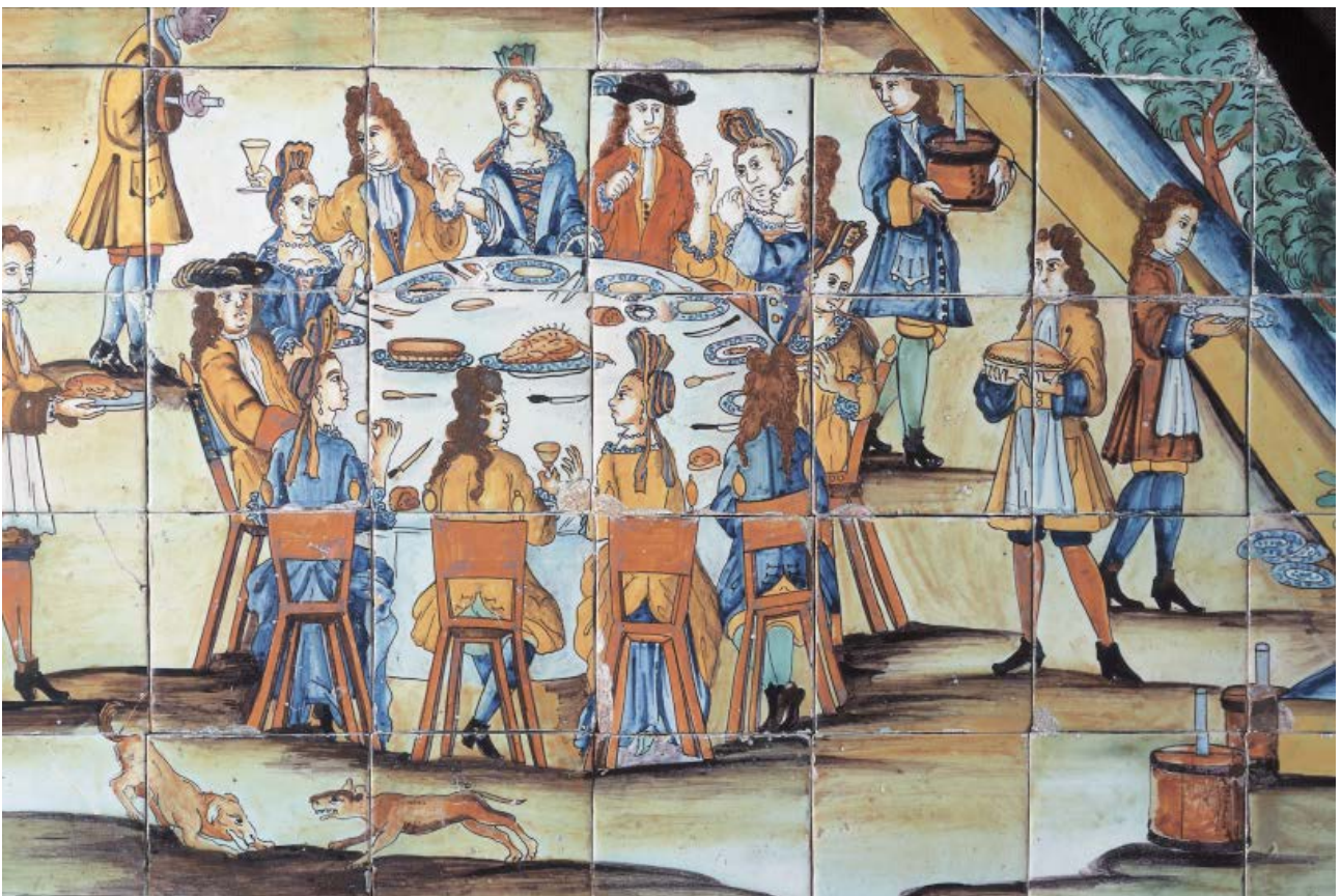
Panell de rajoles de ceràmica on es representa una xocolatada, 1710, procedent d'Allella.

L'influx i la presència pública dels gremis en la vida urbana era enorme atès que participaven en la defensa de la ciutat, eren bàsics en processons i desfilades i prestaven assistència a vídues i orfes dels seus agremiats. Tots ells es trobaven ja aleshores involucrats en els cercles de la protoindústria rural i així podien diversificar la seva producció entre productes artesanals per a un mercat més ric, essencialment urbà, i productes de menys qualitat per a una demanda popular.