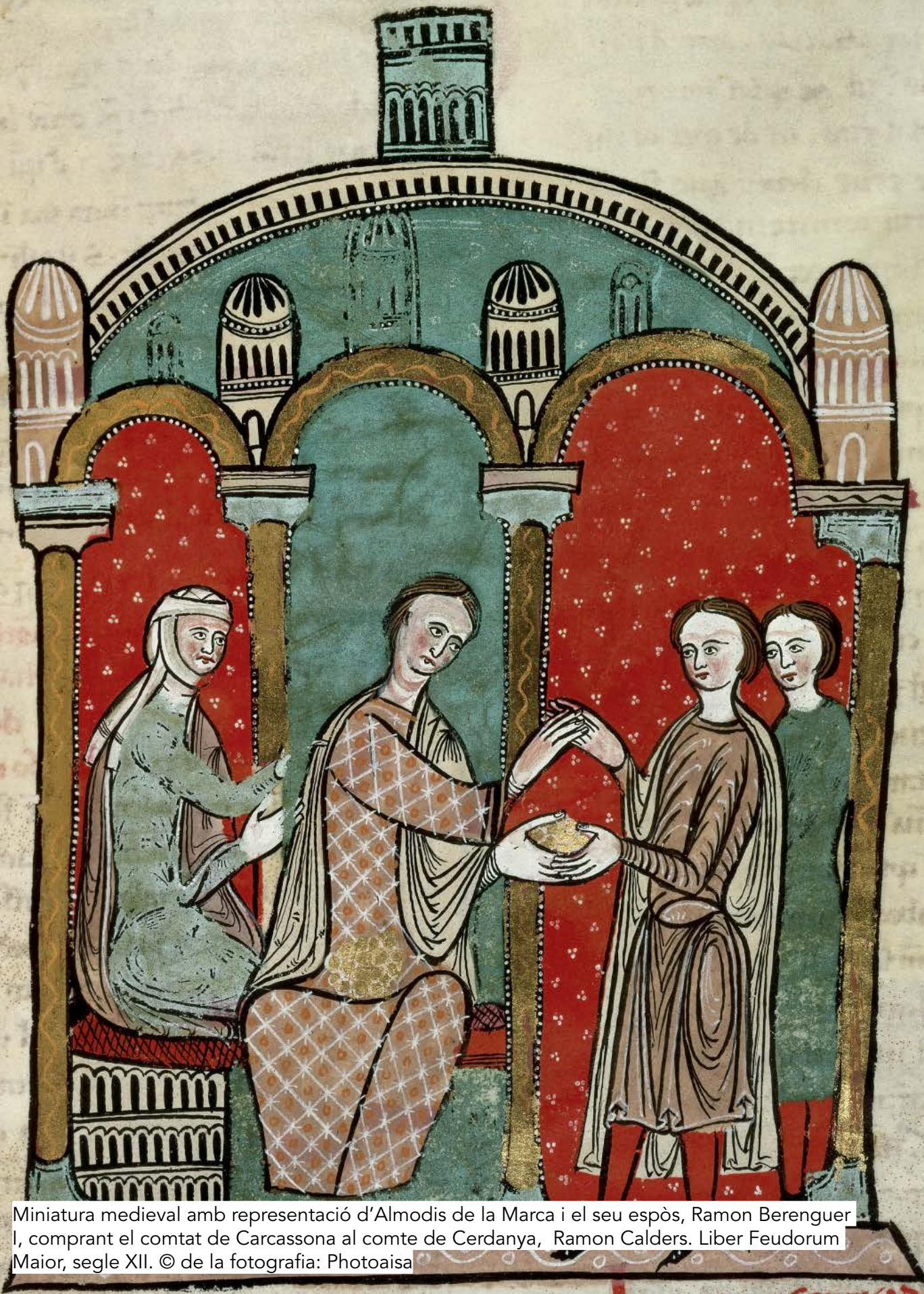
Miniatura medieval amb representació d'Almodis de la Marca i el seu espòs, Ramon Berenguer I, comprant el comtat de Carcassona al comte de Cerdanya, Ramon Calders. Liber Feudorum Maior, segle XII.