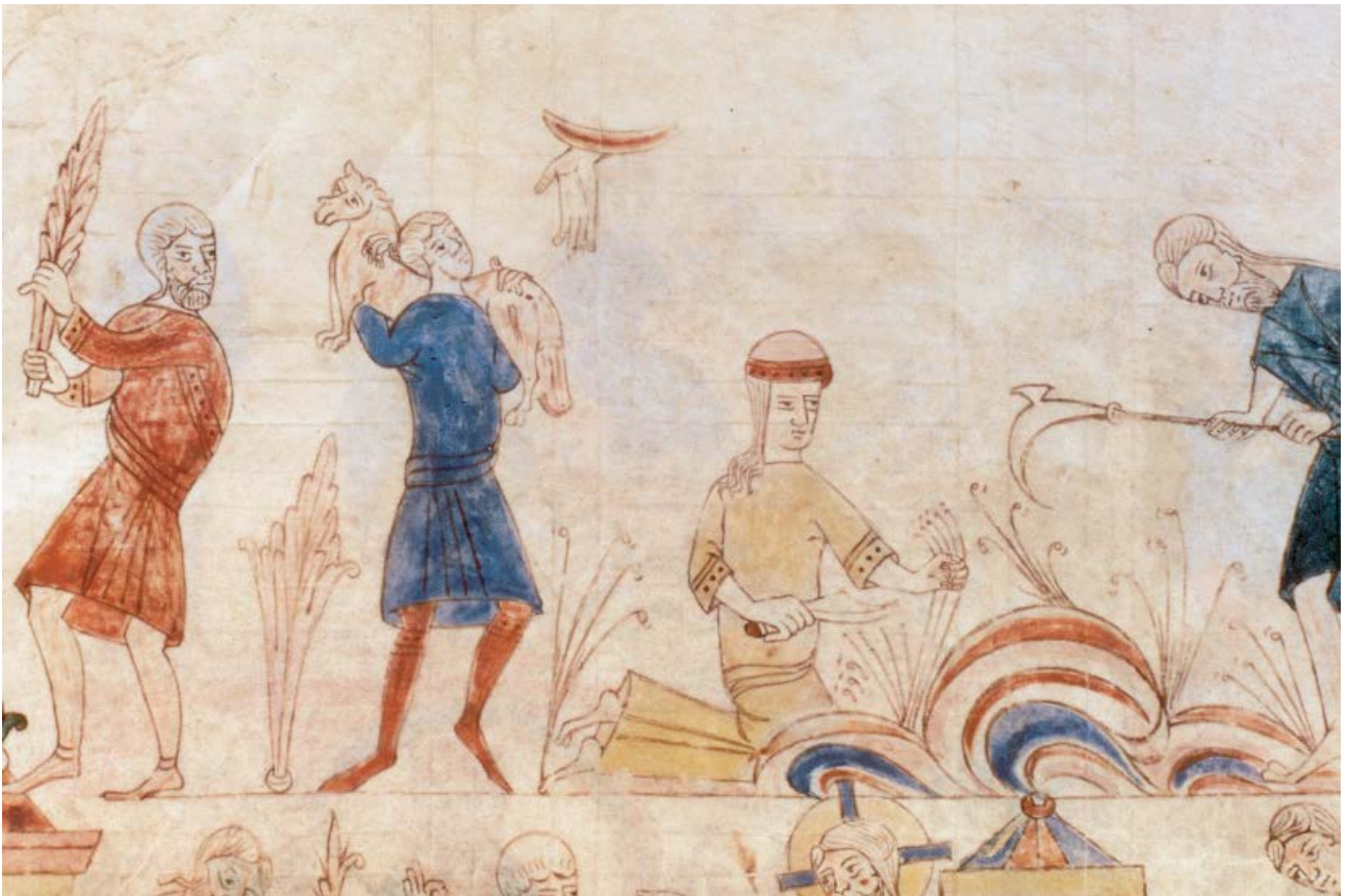
Detall de la Bíblia de Ripoll , segle XI. Adam segant amb una dalla i, al seu costat, Eva fent-ho amb una falç.

Hi hagué moments de fam, famílies que empenyoraven les terres a canvi de cereal per poder menjar i plantar (Benito, 1999, p. 189-203), repobladors que van haver d'abandonar les aprisions i tornar-se'n. El bisbe Oliba de Vic, l'any 1023, deia: «S'ha presentat l'eixorquia de la fam i la misèria de la sequera en aquesta nostra regió; per això molts dels conreadors se n'anaren a Tolosa i per aquest estat de necessitat una gran part de la nostra terra ha arribat a la devastació de l'erm» ( Catalunya romànica 9, p. 506). De tota manera, globalment es produïen excedents i aparegueren els primers mercats d'intercanvi en espècies o en diner musulmà a partir de 1010. 6