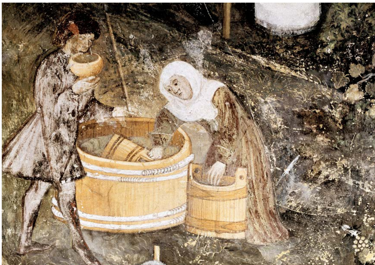
Cicle dels mesos, 1391-1407. El mes de setembre, detall de la preparació del vi. Castell del Buonconsiglio, a la ciutat de Trento.