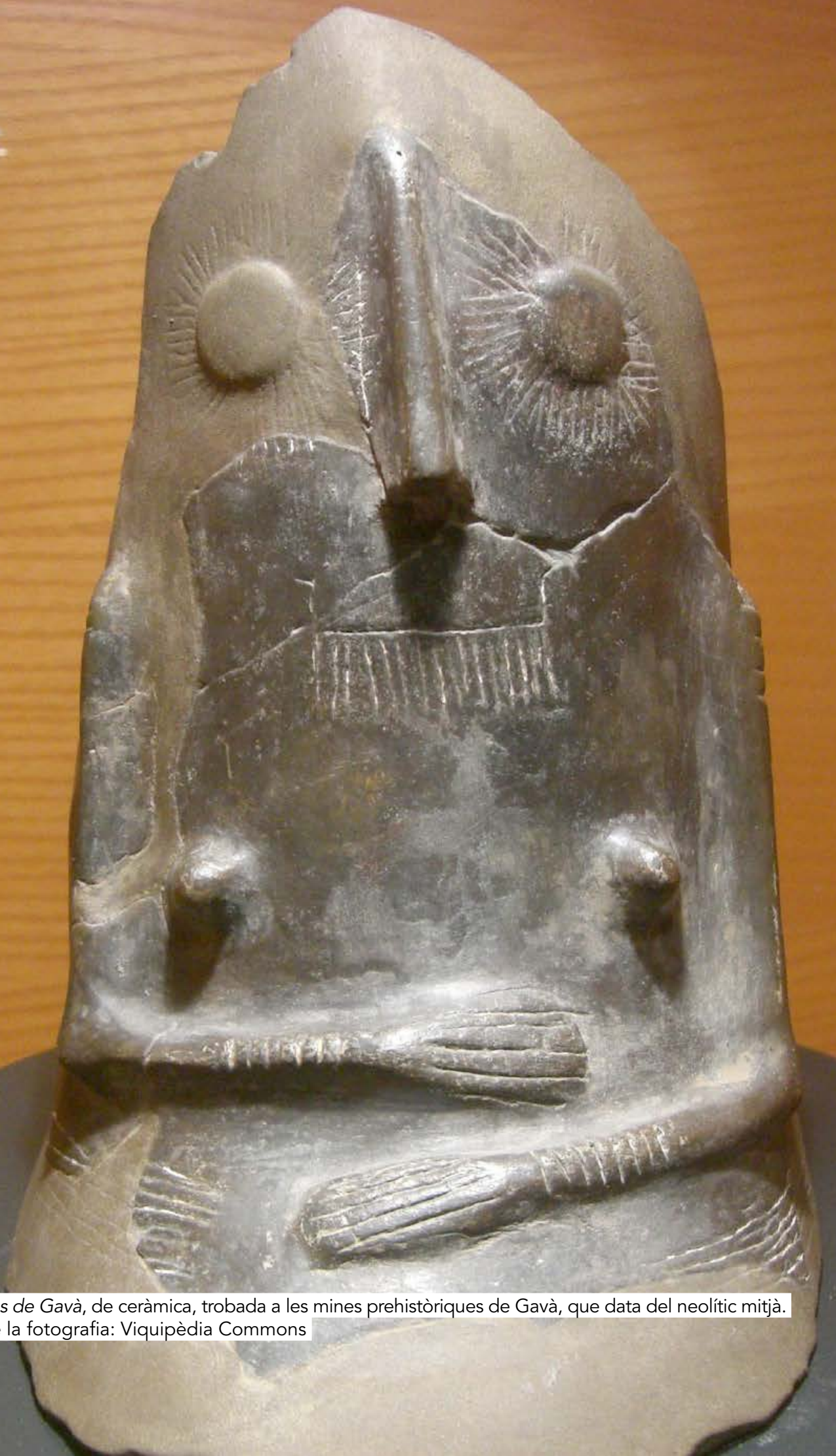
Venus de Gavà, de ceràmica, trobada a les mines prehistòriques de Gavà, que data del neolític mitjà.