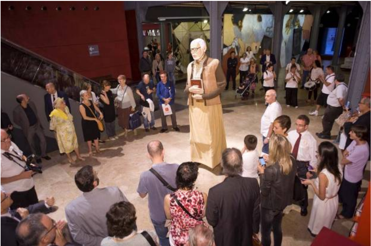
El vestíbul del Museu d'Història de Catalunya va acollir un ball del gegantó del Candel acompanyat dels grallers de la colla de gegants del barri de la Marina de Barcelona i la interpretació de tres havaneres a càrrec de la coral 'La joia de Montjuïc'.